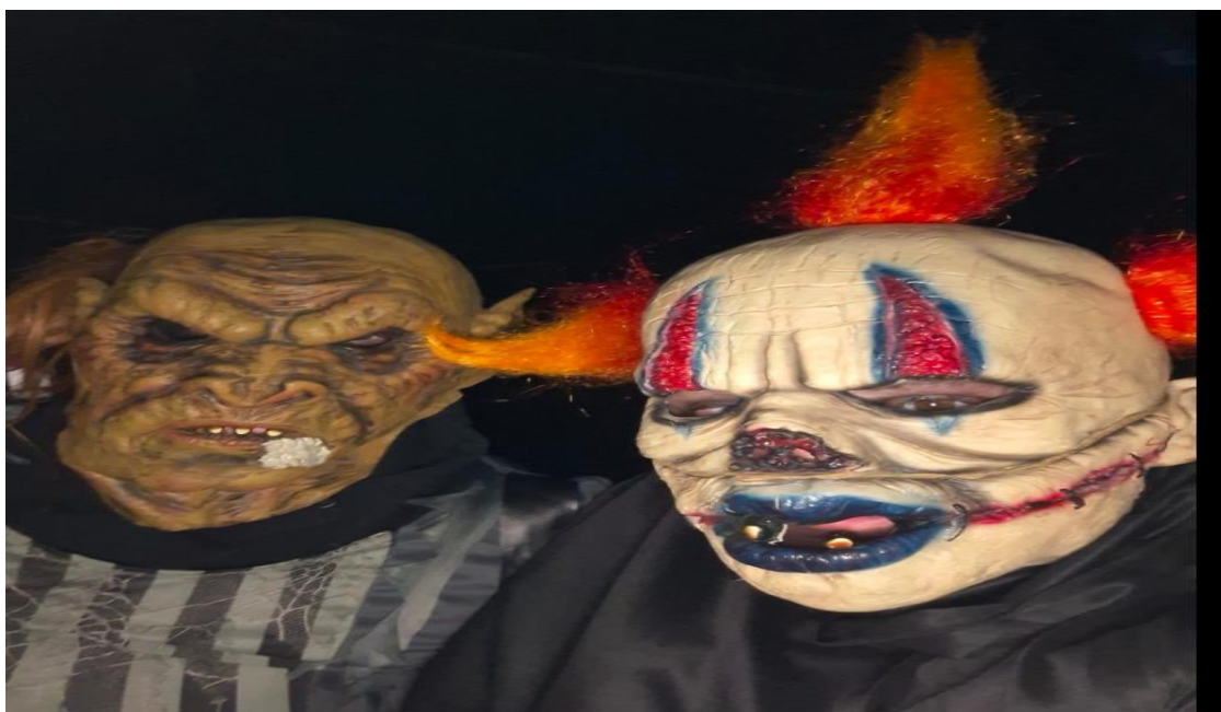
-Politie kids (Wij)